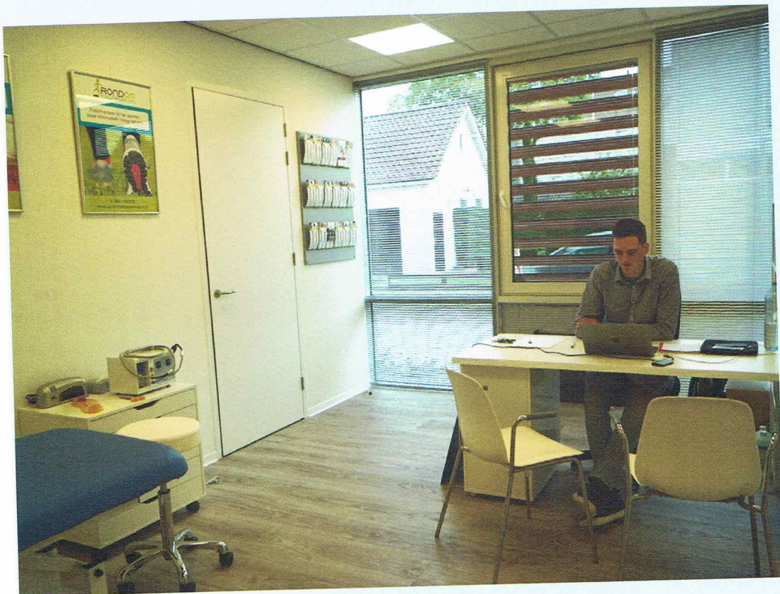
De praktijkruimte van de podotherapeut "Rondom"