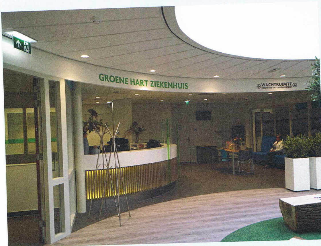
Centrale hal op 1e verdieping met o.a. huisartsen, fysiotherapie, tandarts en het Groene Hart Ziekenhuis