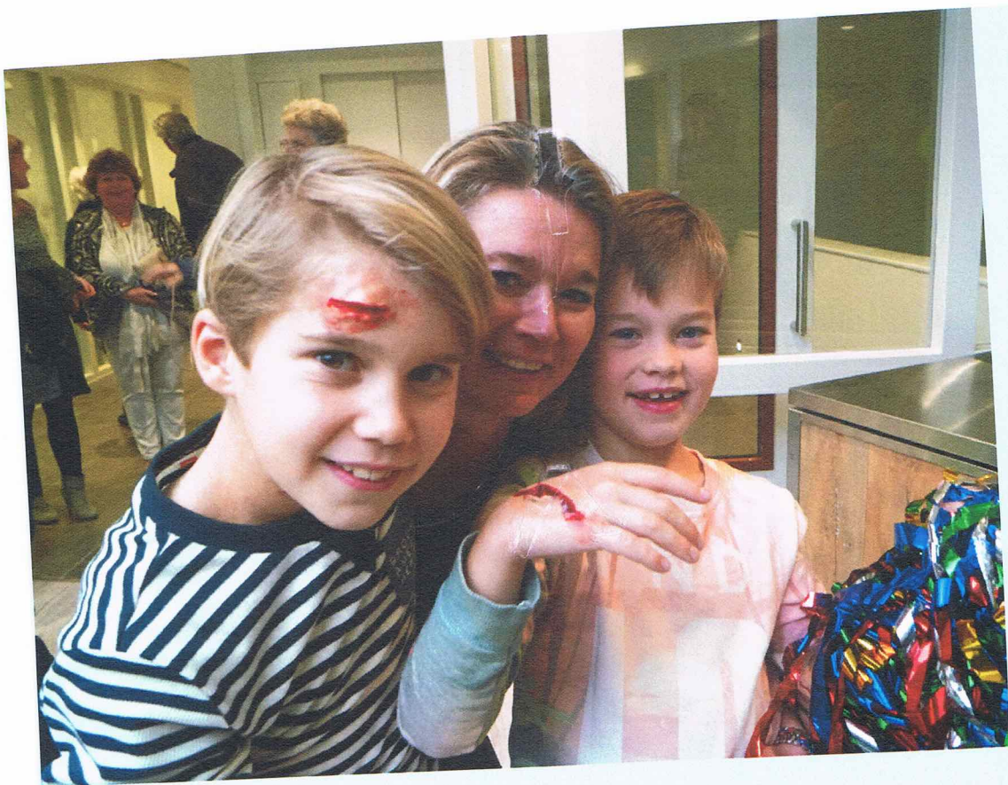
Meestal ga je naar de dokter om een wond te behandelen, maar vandaag werden de wonden geschminkt