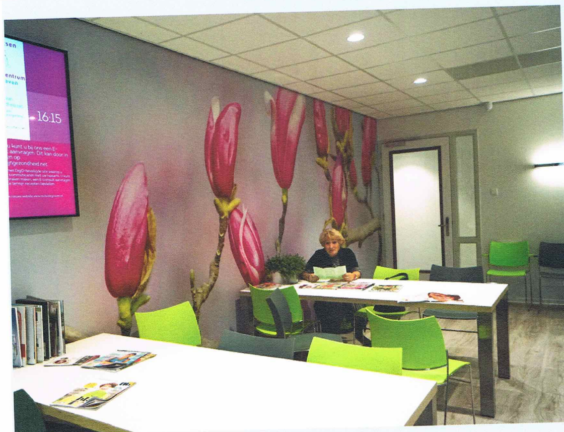
Wachtkamer van de huisartsen